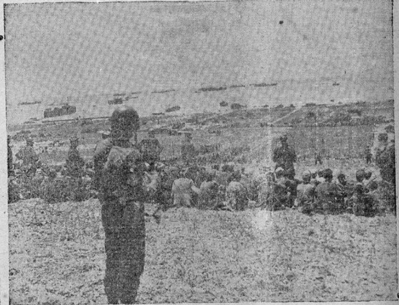
Estos soldados del Eje, capturados por las fuerzas norteamericanas durante la campaña de Sicilia, esperan el momento de ser transportados al Africa septentrional a bordo de los barcos aliados que se ven anclados en la bahía. Las autoridades militares de los Estados Unidos han puesto en libertad a numerosos prisioneros italianos para que continúen en paz el cultivo de la tierra nativa.