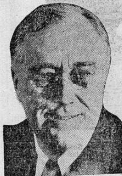
Franklin D. Roosevelt

With the passing of Time, we have arrived at the eve of another anniversary of the birth of His Excellency Franklin D. Roosevelt, the illustrious President of the Republic of the United States of America.