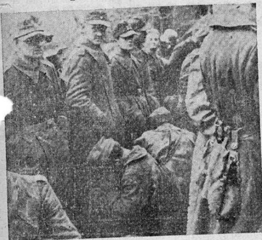
Soldados nazis que fueron hechos prisioneros por las fuerzas de los Estados Unidos esperan su traslado a un campamento. Foto transmitida a Washington por radio desde Argelia.