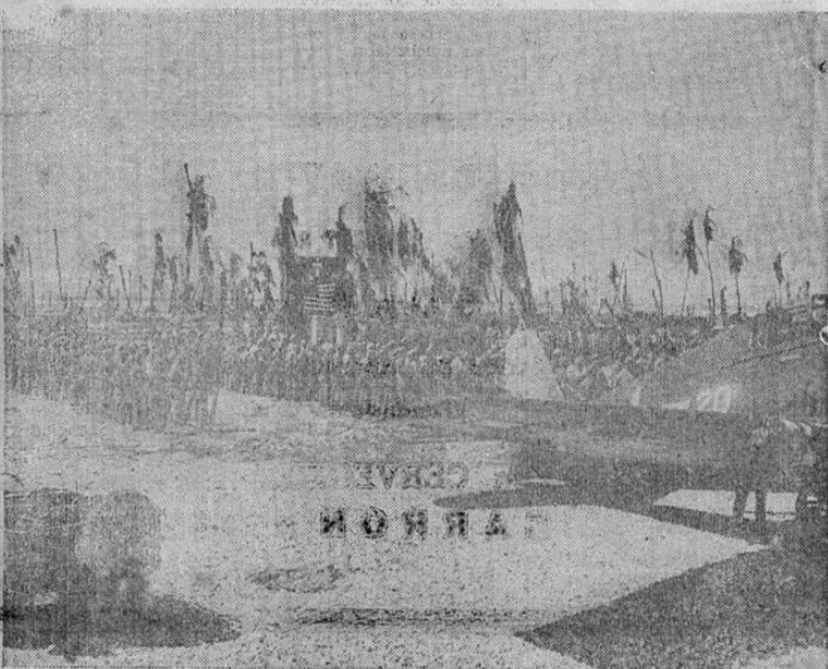
Destacamentos de infantería de marina de los Estados Unidos tomaron parte en Tarawa, en el Pacífico central, en las ceremonias celebradas en honor de los muertos en el ataque que arrebató la isla a los japoneses. Los erectos troncos de los cocoteros, privados de sus palmas, son testimonio mudo de la violencia del combate.